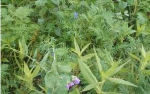
Abbildung 4: Erbse, Phacelia, Ramtilkraut, Anfang November. Dicht und vielfältig