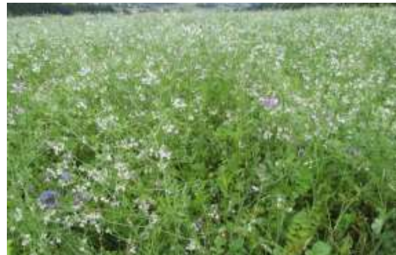
Abbildung 1: Gelungene Zwischenfrucht nach Wintergerste, Anfang Oktober

Einige Betriebe säen ihre Zwischenfrucht unmittelbar nach der Gerstenernte, d. h. in aller Regel noch im Juli. Aber auch nach den anderen Getreidearten sind normalerweise Aussaten bis spätestens 10. August möglich. Alternativ können Sie die erste Welle des Ausfallgetreides abwarten, dann nach ca. 14 Tagen flach bearbeiten und direkt danach die Zwischenfrucht säen.