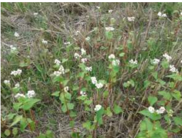
Abbildung 5: Buchweizen Mitte September, Rein- saat , mit dem Schneckenkornstreuer vor der Weizenernte gestreut. Auf Bodenbearbeitung wurde vollständig verzichtet (Demofläche).

Fazit: Gut etablierte Zwischenfrüchte können Dünger sehr gut verwerten.