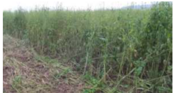
Abbildung 3: Sehr hoher Senf in Reinsaat, 20. Dezember. Viele Stängel, wenig Masse.

empfehlen mindestens drei Komponenten. Dabei bieten sich u. a. Phacelia, Ramtillkraut und verschiedene Kleearten an. Im Idealfall wählen Sie Kulturen mit unterschiedlichen Wurzelsystemen: Flach- und Tiefwurzler, Leguminosen und Nicht-Leguminosen. Bei getreidebetonten Fruchtfolgen raten wir grundsätzlich von Gräsern in der Mischung ab.